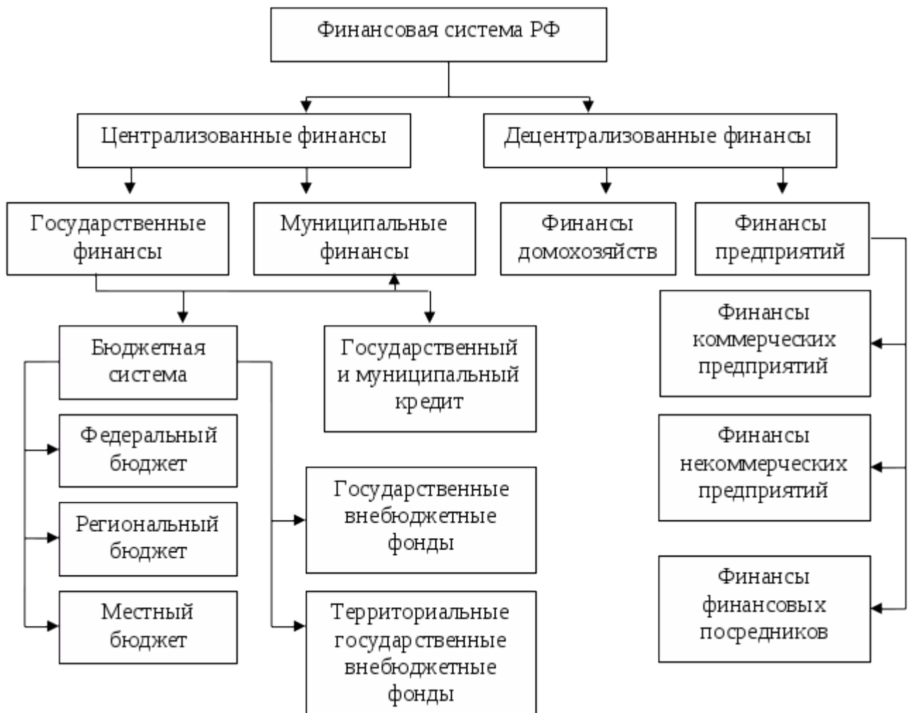
Рисунок 3 – Финансовая система РФ

Таким образом, централизованные финансы используются для регулирования экономики и социальных отношений на макроуровне, а децентрализованные – финансы хозяйствующих субъектов, используемые для обеспечения воспроизводственного процесса денежными средствами на микроуровне.