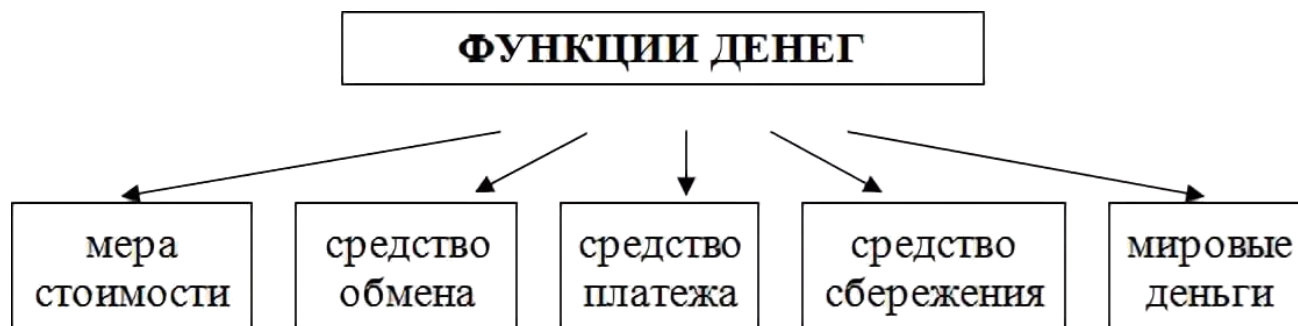
Рисунок 1 – Функции денег

Сущность денег как экономической категории проявляется в их функциях, которые выражают внутреннюю основу содержания денег. Деньги выполняют следующие пять функций :